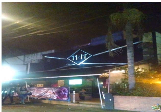
Foto No. 2 Descripción del predio